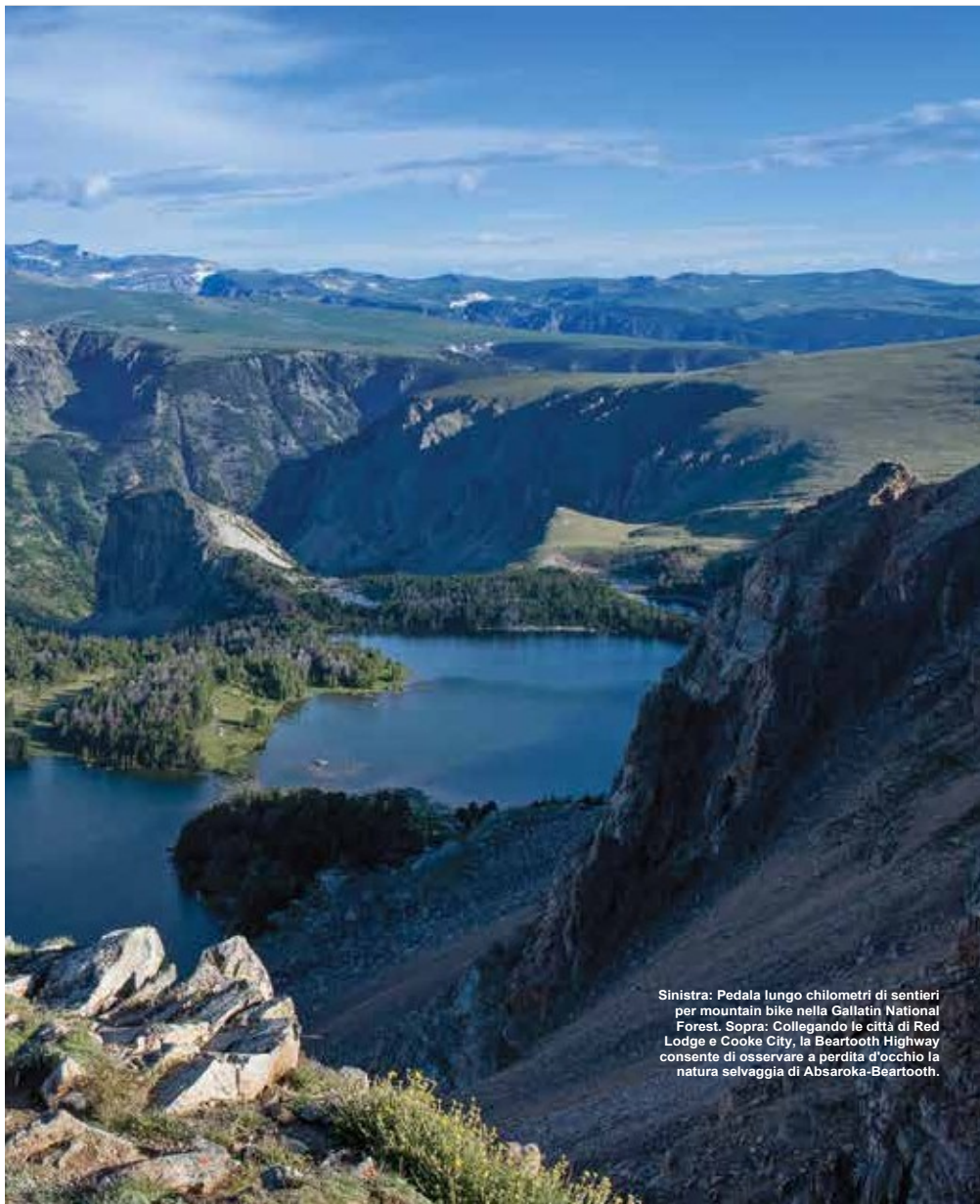
Sinistra: Pedala lungo chilometri di sentieri per mountain bike nella Gallatin National Forest. Sopra: Collegando le città di Red Lodge e Cooke City, la Beartooth Highway consente di osservare a perdita d'occhio la natura selvaggia di Absaroka-Beartooth.

BICYCLE POWER Rallenta per goderti il panorama a Missoula, una comunità biker friendly. Noleggia una bicicletta e percorri il sentiero Riverfront fino alla rotonda scolpita a mano per Missoula. Pedala per il campus dell'Università del Montana o lungo il percorso del Missoula Microbrew Tour. Parcheggia la bici il tempo necessario a fare un'escursione alla M, il sentiero per eccellenza della città e vai a fare surf con lo stile del Montana a Brennan's Wave, dove troverai rapide create dall'uomo sul fiume Clark Fork.