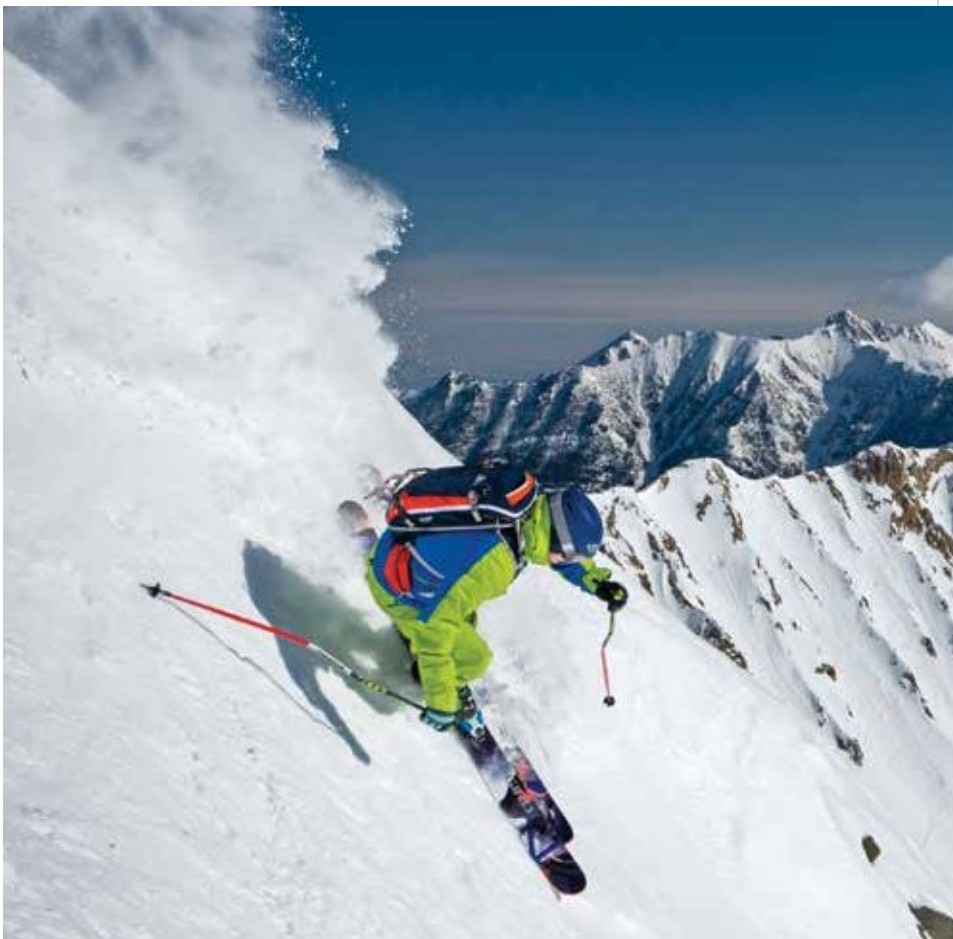
Sopra a sinistra: Cavalca nel Glacier National Park con la Swan Mountain Outfitters. Sotto a sinistra: Oltre 60 edifici rimangono a Bannack State Park, la città fantasma meglio conservata del Montana. Sopra: Conquista terreni da esperti ed estremi sul Lone Peak al Big Sky Resort. Sotto: la deliziosa città di Philipsburg è geologicamente ricca di vasti depositi minerari ed è il luogo dove andare per scavare zaffiri.

CATTURA E LIBERA Trascorri la giornata pescando (o imparando a pescare a mosca) nella piccola cittadina di Ennis con esperti quali Tackle Shop, Madison River Fishing Company e Trout Stalkers. Acquista o noleggia l'attrezzatura, prenota un tour guidato di pesca a mosca (da aprile al 1 novembre) o chiedi consigli di pesca. Continua fino alle sorgenti Norris Hot Springs, note in zona come le “acque degli dei”. Mentre sei immerso, cerca di avvistare daini e antilopi.