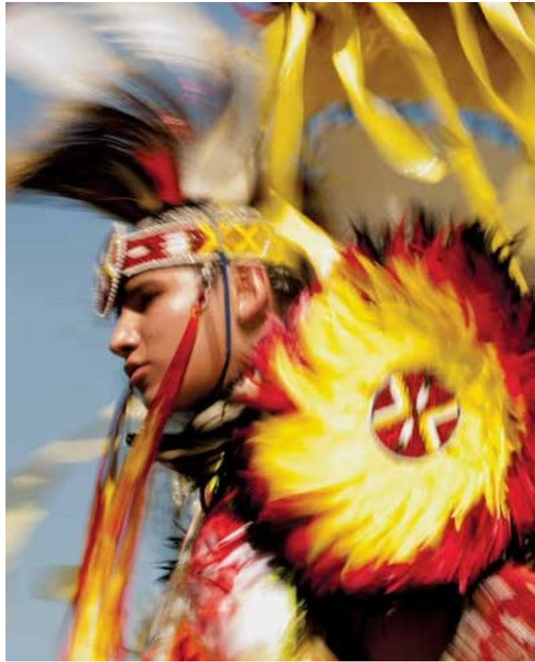
Sopra a sinistra: osserva in primo piano gli animali selvatici al Grizzly and Wolf Discovery Center a West Yellowstone. Sotto a sinistra: assisti al rodeo dei cavalli al Bucking Horse Sale di Miles City. Scopri le tradizioni alla Crow Fair Celebration. Sotto: gli chef locali spesso accostano le spugnole fresche, disponibili in primavera, al manzo del Montana.