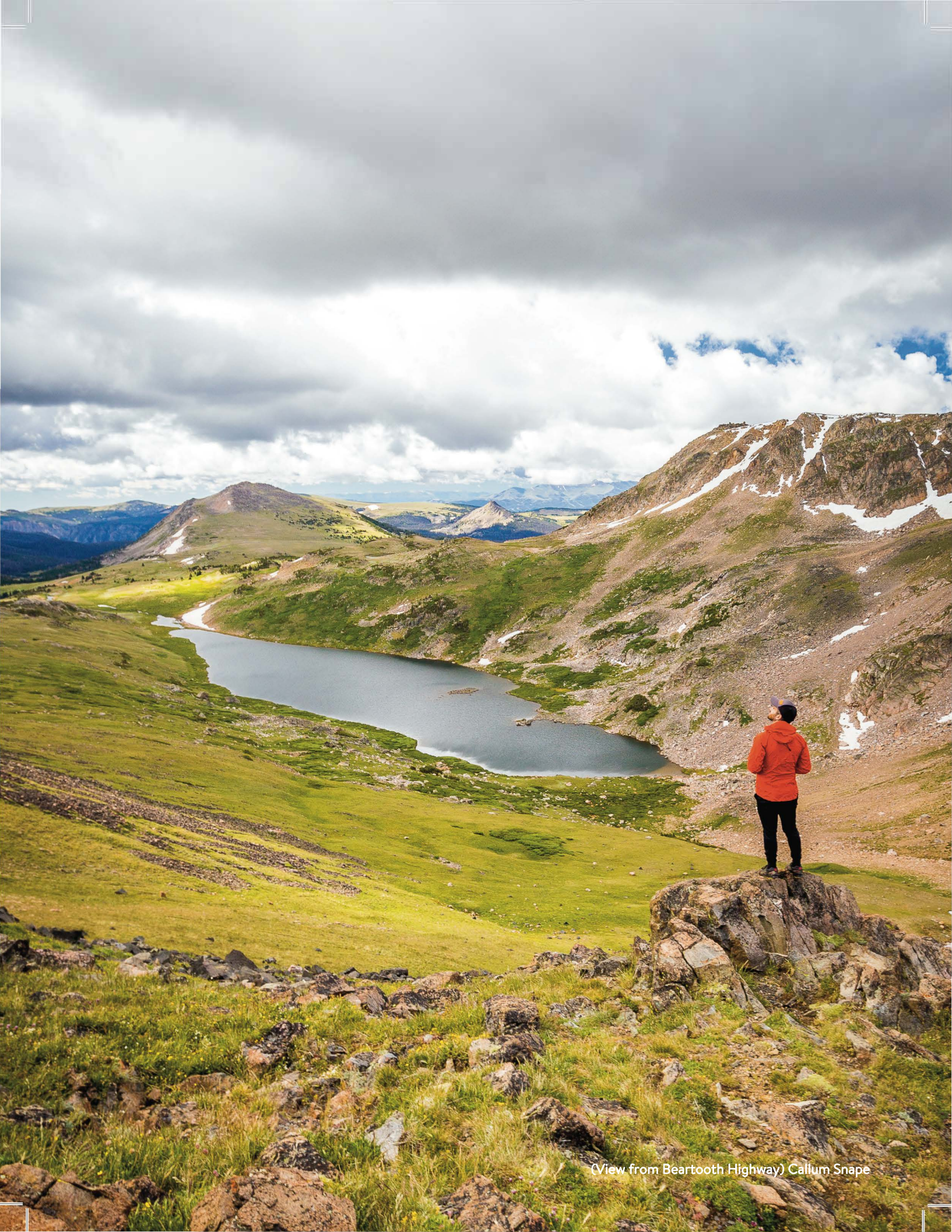
(View from Beartooth Highway) Callum Snape